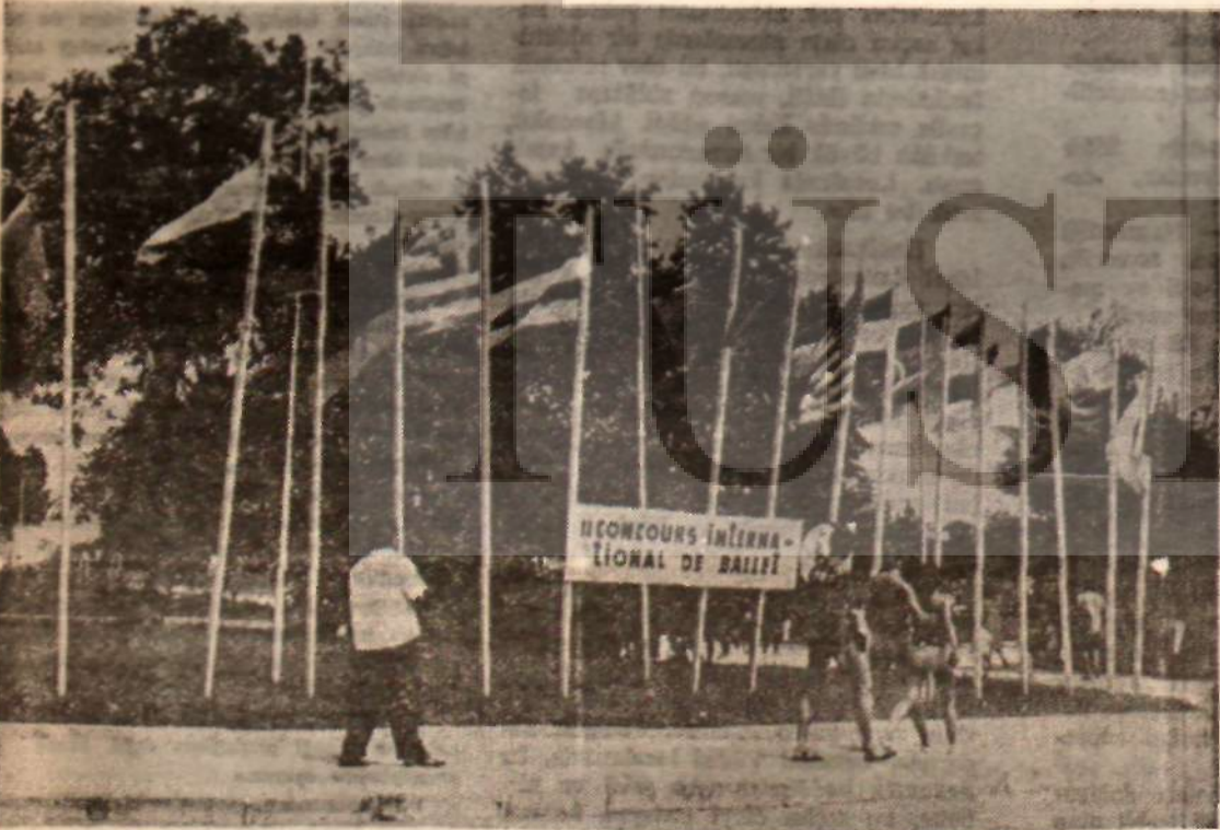
Varna'daki uluslararası bale yarışına bir tek balerinle biz de katıldık. Birinciliği bir Küba'lı aldı. Resimde yarışçı ulusların bayrakları.

Gezim sırasında tiyatro ve bale çalışmalarını tatıldi. Bazı gruplar turneye çıkıyorlar. Bu alanda hiçbir örnek göremedim. Geçen yıl İvan Vazof Tiyatrosu'nda oynanan «S» adlı oyunu çok ödüler. Oyunu ozan Cazarof yazmış. Cazarof'la Sofya'da avaküstü el sıkıştık. 1944 öncesinde bir olayı Stalin zamanına uzulmuş. Anlatıldığına göre iki genç var. Birisi savcı, birisi sanık. Babaları, faşizmle vanılan savasta berabermiş. Soru varızki, genç sanığı cezalandırmak istiyor Savcı, «Babalarımız beraberdi bir de avrılmıyacak» diyor arkadaşını tutuyor. Cazarof oyunu «ekiz duruşma» halinde işlemiş. Önce hiçbir tiyatroya Saverji oynamak istememiş. Ama Cazarof savcıyı, Bileşim Başkan Cıvkof, Pıv, dişe doğru bir ceza çıkırmış. Cazarof özel arabasına binmiş, Başbakanın ardına düşmüş. Polisler