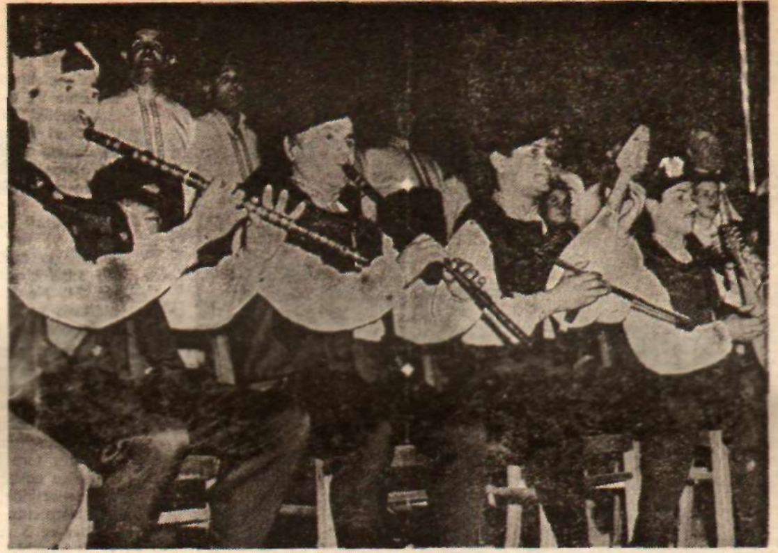
Kültür şenlikleri, köylüleri de içine alacak biçimde düzenleniyor. Türkü ve oyun yarışmaları günlerce sürüyor. Bunlardan bir grup.

rastlamadım. Kısa mısra hevesi, daha hiç kitap bastırılmamış genç ozanlara da geçmiş. Donka Melmedin'ın damadı Petko Bratinov, 1966 da 700 mısralık bir kitap çıkaracak. İlk şiir kitabı. Onun mısraları da kısaydı. Petko, şiirlerinin çoğunda Amerikalı gençlere sesleniyordu.